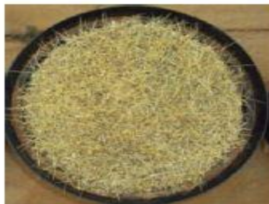
1 mês sem irrigar