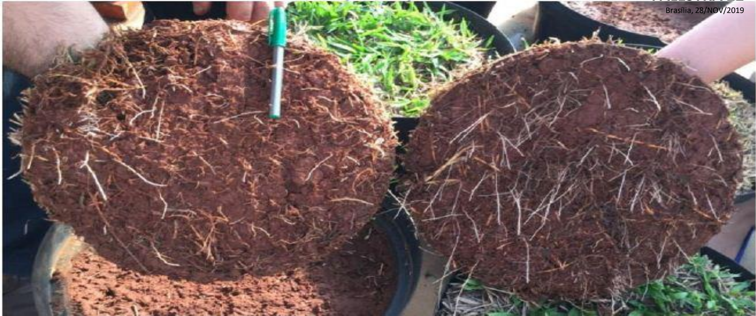
Esmeralda: solo baixa fertilidade