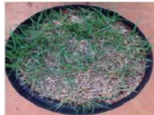
3 semanas irrigando