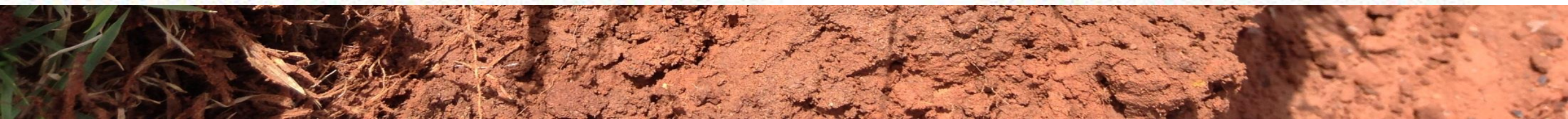
Esmeralda: solo fértil