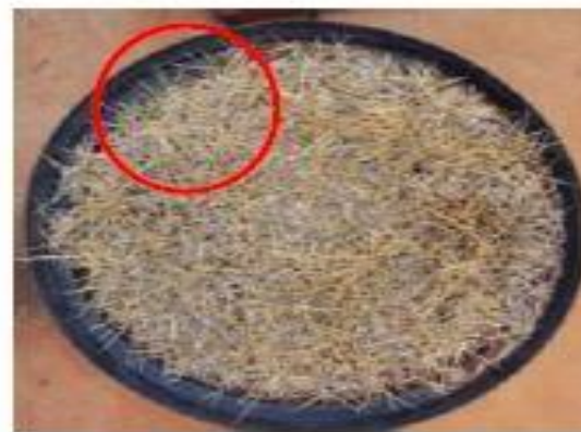
1 semana irrigando